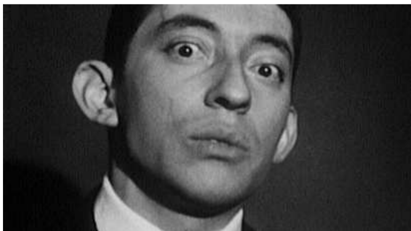
Rive droite - Jean-Paul CARRERE © INA

BBC 4 / JIGSAW Productions / Diverse Ltd / ARTE France / SBS Australie / TV 2 Denmark / History Television (Canada).