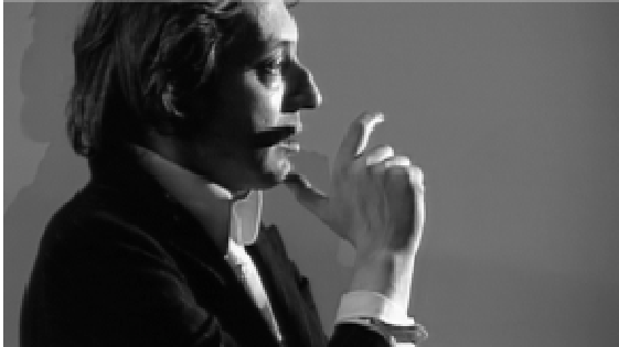
Au fil des rues : Créteil – Josée DAYAN

Comme ce documentaire est fait pour le cinéma, on est obligé de prendre des droits monde sur trente ans, ce qui représente des montants colossaux.